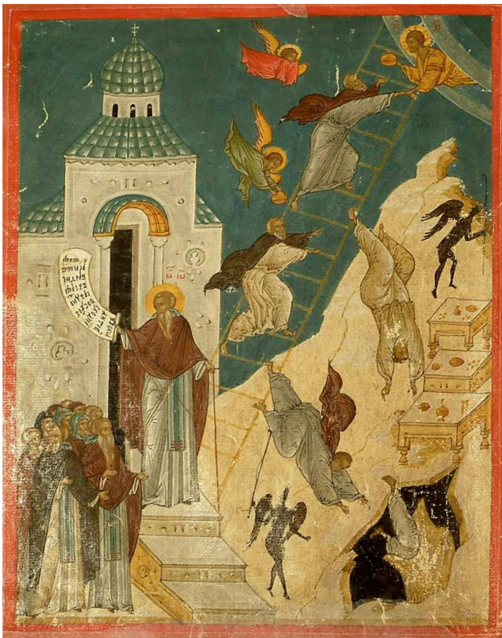
Рисунок 1. Миниатюра из книги «Лестница» Иоанна Лествичника, нач. XVI в.

Мира и не существовало. Поэтому внедрение теории гуманистов было лукавым и насильственным.